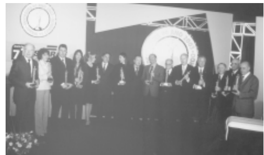
Os contemplados nesta edição.