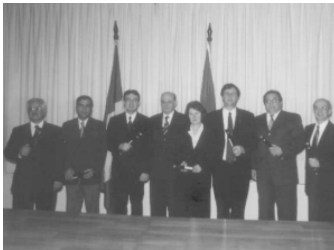
Agraciados com o diploma