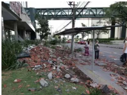
Telhado de shopping caiu e interditou avenida em Porto Alegre