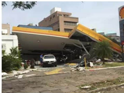
Posto de gasolina ficou destruído na Avenida Praia de Belas