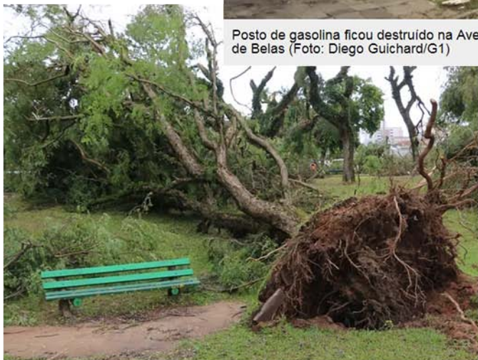
Árvore de parque é arrancada pelo vento durante temporal em Porto Alegre