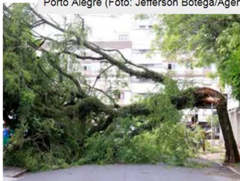
Prefeitura diz que 3 mil árvores foram perdidas com temporal